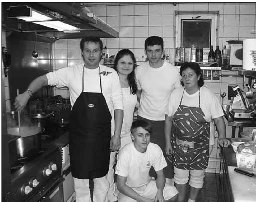
Romana sbírá cenné životní zkušenosti...

Nutně sem potřebovala brigádu na léto, asi tak jako všichni. Tak jsem se poptala po kamarádkách a ty mi řekly, že loni pracovaly v restauracích v okolí, jak na „plac“ , tak i v kuchyni, a že to bylo docela v pohodě. Tak jsem se vydala do Albera ve Valticích a tam měli ještě poslední volné místo; tak jsem ho brala.