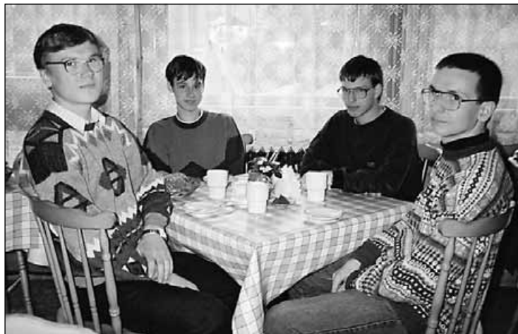
Šílená pařba na fakultě elektrotechniky

Na naší škole je drtivá většina nekuřáků. Jen dva učitelé potřebují cigaretu ke svému životu – kouří pravidelně, další pouze příležitostně. A zde jsou ty zajímavější odpovědi: